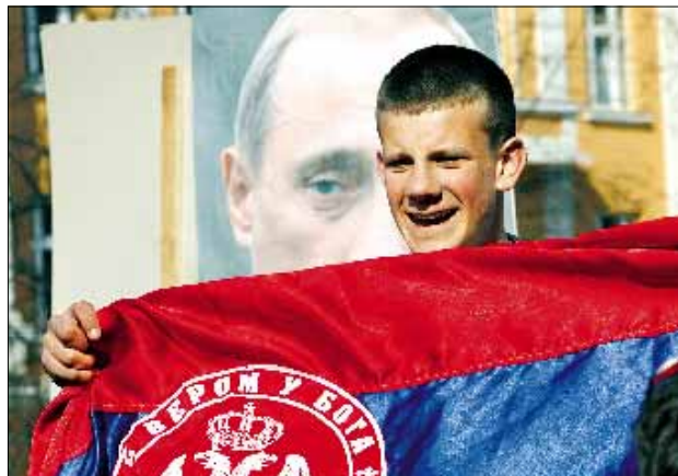
Manifestazioni contro l'indipendenza del Kosovo nella città serbo-bosniaca di Banja Luka